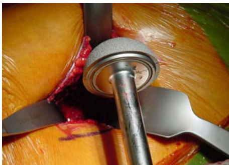
Einsetzen der Hüftpfanne